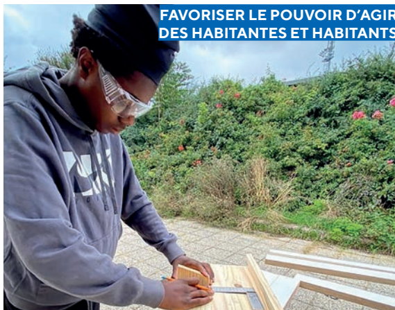
- Projet d'économie circulaire et d'insertion auprès des jeunes, Au fil de l'eau, Valophis Habitat, Choisy-le-Roi -