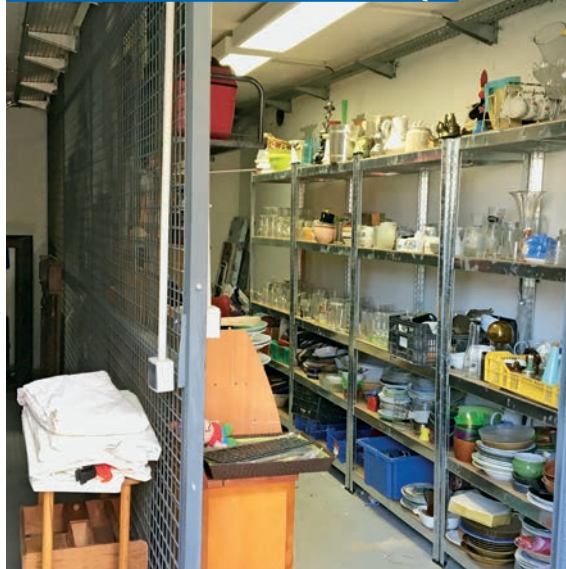
- Projet de tri et de valorisation des encombrants, Environnements solidaires, Atlantique Habitation, Nantes Métropole Habitat, CDC Habitat, Habitat 44, Harmonie Habitat, La Nantaise d'Habitations, Nantes et Saint-Herblain