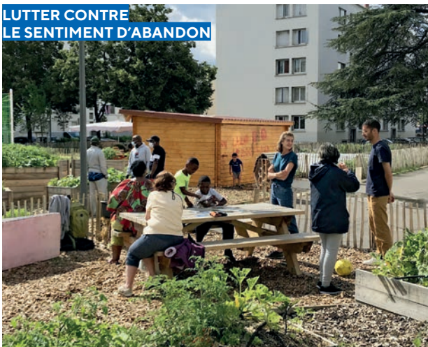
- Projet d'agriculture urbaine, Le 8 e Cèdre, Place au Terreau et Grand Lyon Habitat, Lyon -

L'abattement de la TFPB est un dispositif souple qui permet aux partenaires institutionnels de créer les conditions d'une participation active et au long-cours des locataires-habitants.