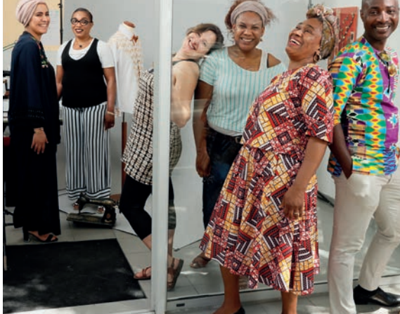
- Projet d'insertion et de développement d'activités, En découdre avec l'emploi, Espace Textile Rive Droite, Domofrance, Bordeaux / © Rodolphe Escher -

L'abattement de la TFPB, par sa souplesse permet aux équipes des bailleurs sociaux, de développer des réponses innovantes dans un partenariat ouvert et durable avec les acteurs de l'Économie Sociale et Solidaire (ingénierie de projet, financements, locaux d'activité, réseaux, etc.). Ces projets permettent d'inventer et de tester des solutions pour et avec les habitants afin de faire face aux difficultés récurrentes des quartiers, et répondre aux nouveaux défis liés aux transitions écologiques et démographiques.