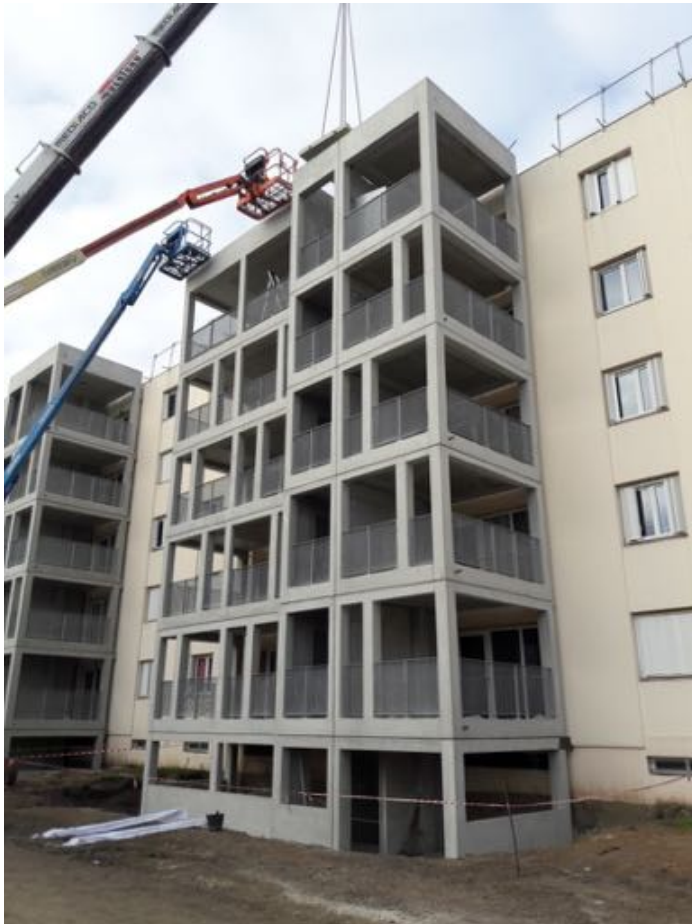
Mise en œuvre de balcons et d'ascenseurs